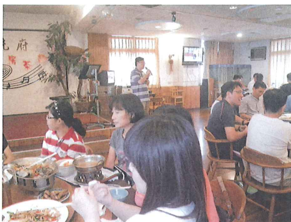
照片 3：學務主任報告