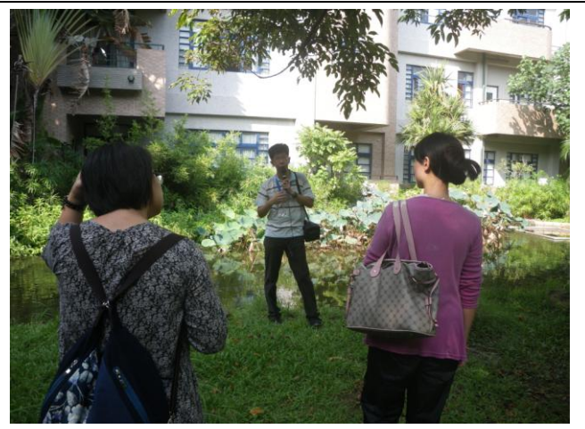
照片 16. : 中國意象圖