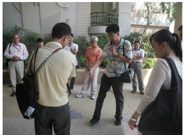
照片 12. : 總務主任介紹億載意象