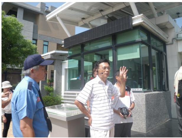
照片 7. : 社區主委介紹