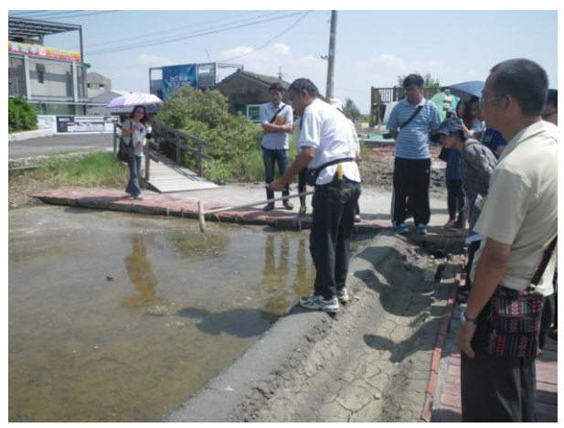
照片 10. : 鹽田曬鹽傳統