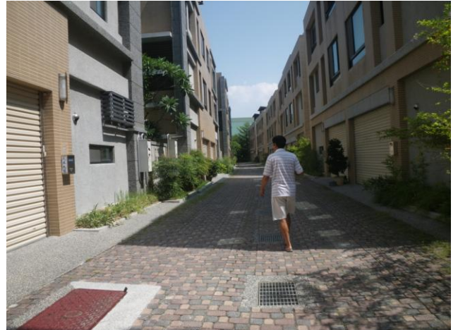
照片 8. : 陽光社區環境