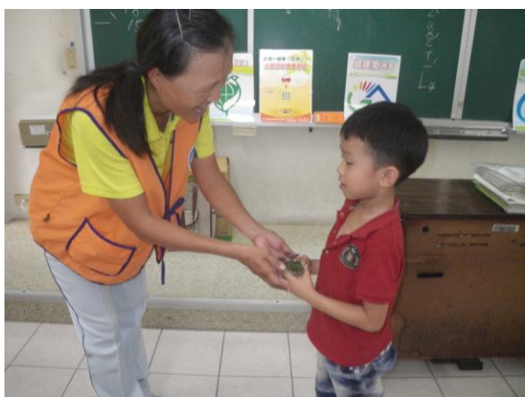
照片 5：巧手做盆栽分享給小朋友