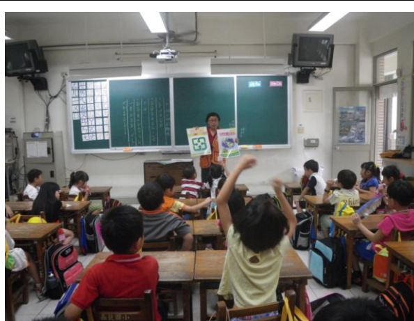
照片 4：回收標章認識