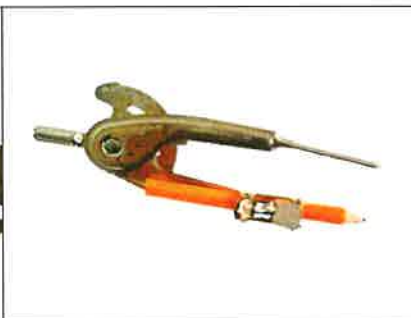
考生可攜帶三角板、直尺、圓規