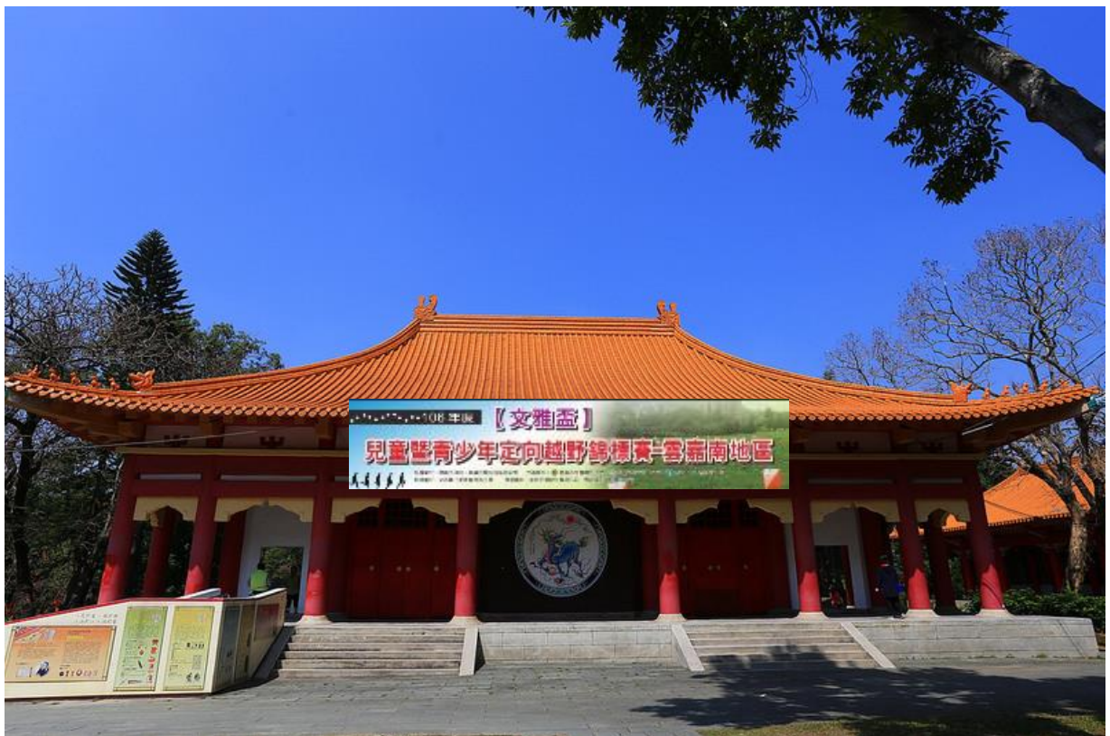
圖2：報到地點-嘉義孔廟 示意圖