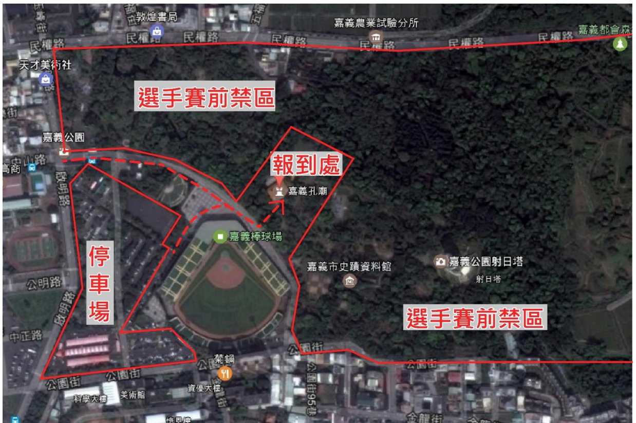
圖1：選手報到與停車示意圖