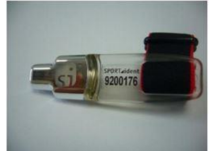
圖4：電子指卡示意圖