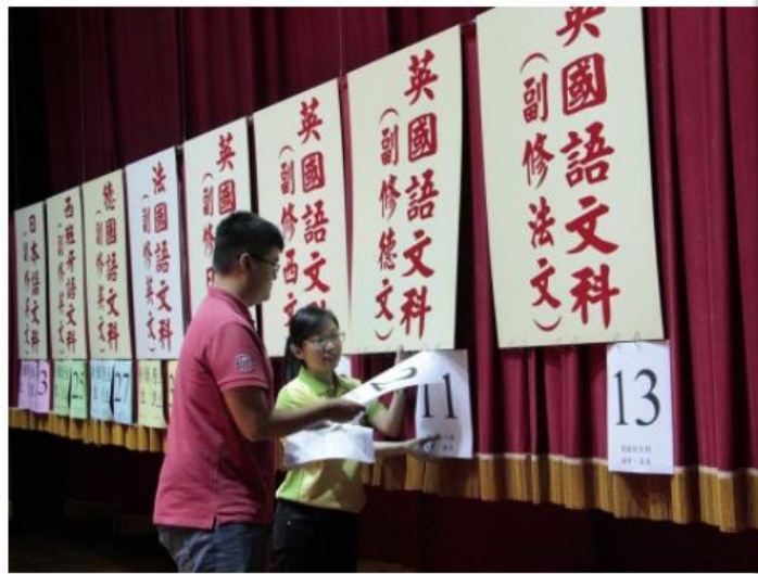
五專優先免試入學，明年試辦電腦填志願，一改傳統的撕榜方式。圖為文藻外語大學五專撕榜畫面。

2017-07-31 23:36 聯合報 記者馮靖慧／台北報導 讚 3 分享 傳送