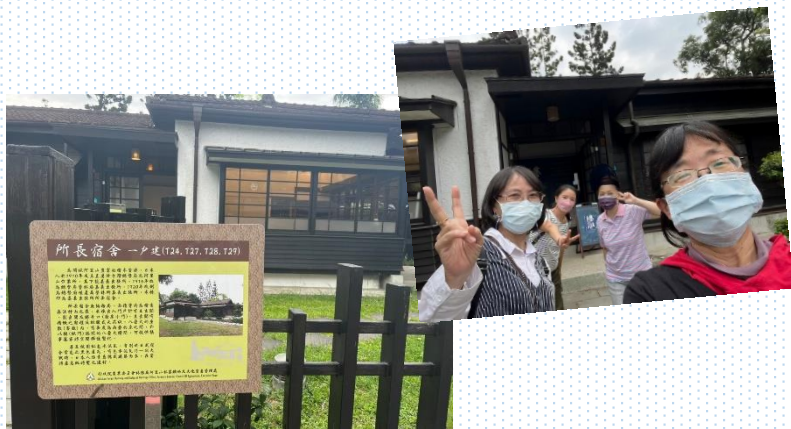
感謝檜森村所長官舍讓我們擁有美好的策展記憶