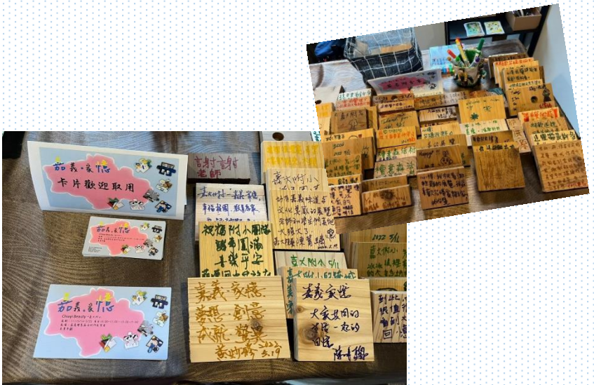
感謝參觀貴賓們留言鼓勵與讚美/謝謝福樟良材贈送香香的檜木