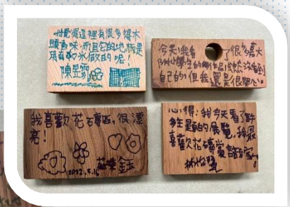
感謝大朋友小朋友們留言鼓勵