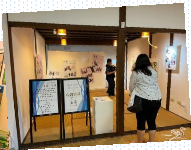
嘉義·家憶策展歷程 逐漸成形