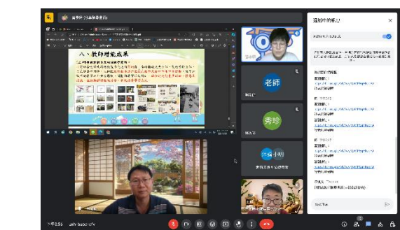
照片簡介：夥伴交流回饋