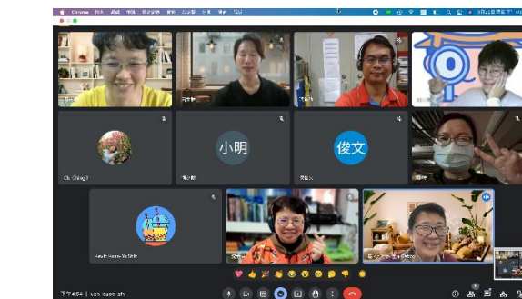
照片簡介：會後合影