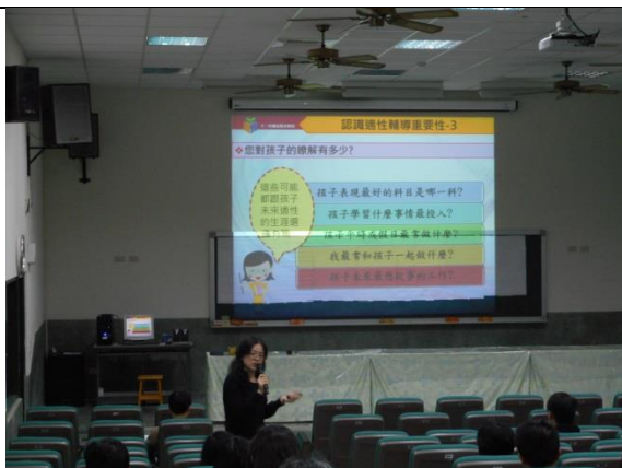
講師向家長說明適性輔導作為