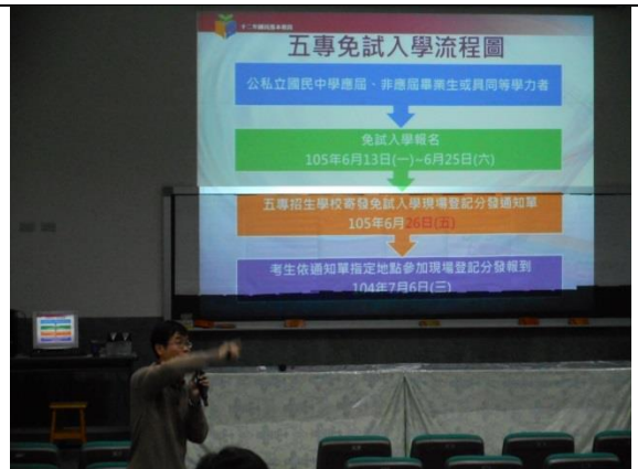
講師向家長說明五專免試入學流程