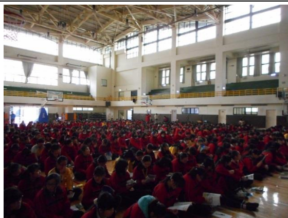
介紹適性入學宣導手冊