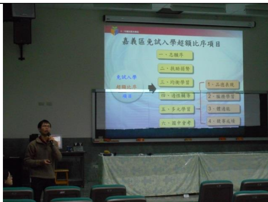
講師向家長宣導嘉義區超額比序積分項目