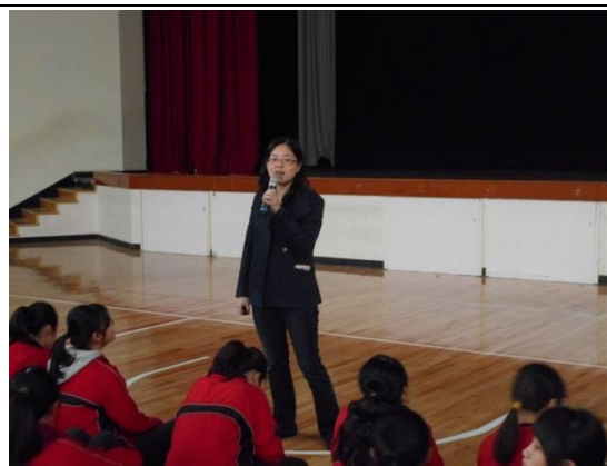
介紹多元入學管道