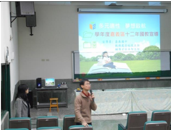
教務主任開場致詞