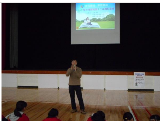
教務主任精神勉勵