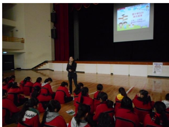
介紹適性入學宣導網站