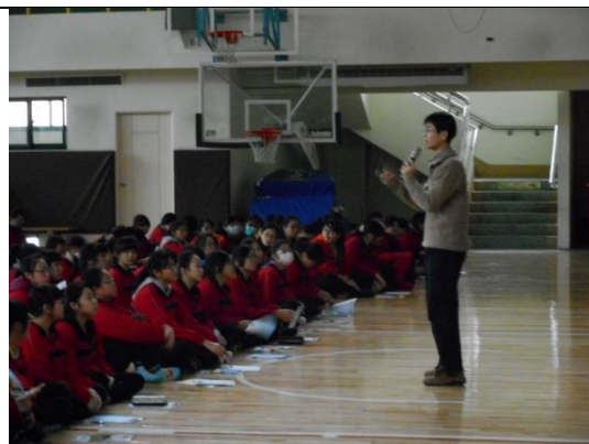
介紹教育會考測驗與計分說明