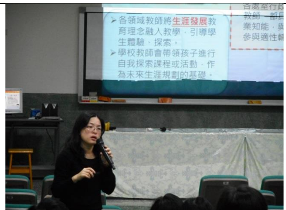
講師與家長作意見交流