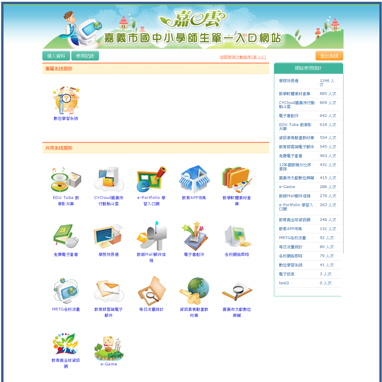
圖一：嘉義市國中小學師生單一入口網站(SSO)