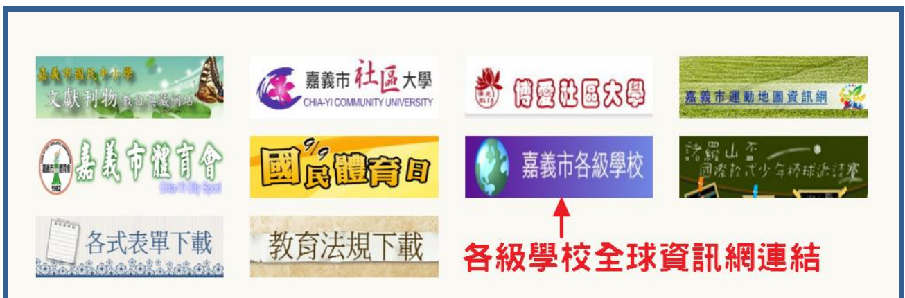
圖二：「嘉義市政府首頁/智慧城市服務/更多服務」各級學校連結