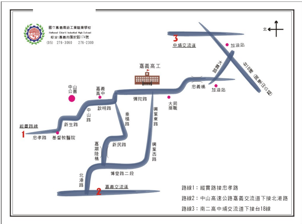
附圖一 國立嘉義高級工業職業學校位置圖

網址： http://www.cyivs.cy.edu.tw/ 地址：60066 嘉義市彌陀路 174 號 電話：05-2763060 轉 1101~1104